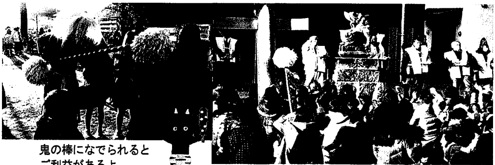
鬼の棒になでられると ご利益があるよ