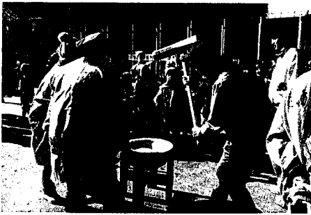
古江新町もちつき大会の様子