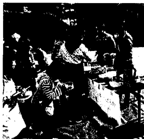
古江東町 きなこ・あんこ・のり... 何にしようかな