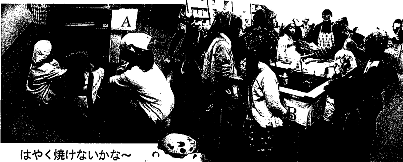
はやく焼けないかな～

2月4日(土)、古田公民館実習室。バレンタインに近いこの日、子どもたちは、午前と午後のコースにわかれ、『ココアケーキ、チョコチップスコーン、簡単なプリン』を母親クラブのメンバーに教わりながら作りました。